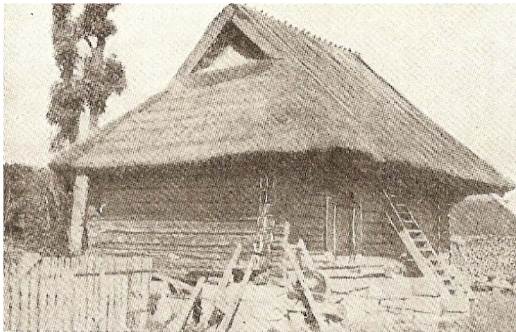
Aitta. Saarenmaa, Kihelkonna.

Aitat ovat ensisijaisesti ruoka-aineiden ja talouskalujen säilytyspaikkoja, mutta niitäkin on tilapäisesti, pääasiassa tosin vain kesäisin, käytetty myös asunoina. Virolaisessa maalaistalossa ovat juuri aitat olleet niitä rakennuksia, joiden suhteen jo vanhastaan on pidetty tavallista enemmän silmällä arkkitehtonisia kauneusarvoja. Aitan hirret ovat usein mahdollisimman tasapaksuista puista tai ne on piiluttu sileiksi. Nurkat on hakattu niin puhtaiksi kuin suinkin, ja etupuolen ylempien hirsien ulkonevat päät on leikattu konsolien tapaan. Ne kannattavat räystästä, joka seinästä etäämmälle ulottuen muodostaa oven eteen syvän katoksen. Monin paikoin Itä- ja Etelä-Virossa, siellä täällä myös saarilla, tällainen katos nojautuu riviin pylväitä, jotka siten muodostavat omalaatuisen avoimen kuistin. Pylväät on usein profiloitu leikkauksin. Aittarakennuksen saattaa kuitenkin ennen muuta näkyviin se, että se on sijoitettu korkeille nurkkakiville tai puolittain avoimelle kivijalalle. Tämä rakenteellinen erikoisuus tekee tarpeelliseksi erityisen korkean permannon tai portaat katoksen alle aitan oven eteen. Kaakkois-Virossa tunnetaan paikoitellen myös kaksinkertaisella parvekkeella varustettuja aittoja. Virolaiset aittarakennukset ovat muotonsa puolesta nimenomaan balttilaisten kansojen aittarakennusten läheisiä sukulaisia. Paikoitellen ruoka-aitat sisältävät myös alkeellisempia piirteitä, joista olennaisimpina mainittakoon multapermanto ja laipion puuttuminen.”